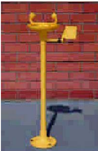
AB002220 AUGENDUSCHE, STANDMODELL, MIT AUFFANGSCHALE AUS ABS-KUNSTSTOFF