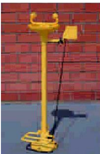
AB002710 AUGENDUSCHE, STANDMODELL, WAHLWEISE BETÄTIGUNG DURCH DRUCKPLATTE ODER FUßPEDAL, AUFFANGSCHALE AUS ABS-KUNSTSTOFF GEFERTIGT