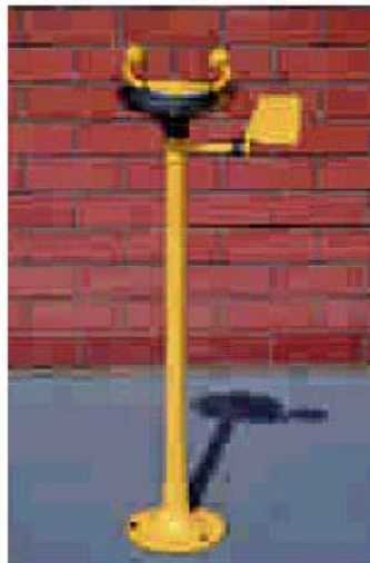
AB02220E AUGENDUSCHE, STANDMODELL, MIT AUFFANGSCHALE AUS EDELSTAHL