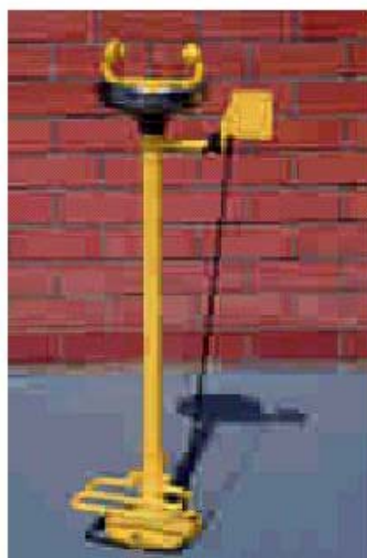
AB02710E AUGENDUSCHE, STANDMODELL, WAHLWEISE BETÄTIGUNG DURCH DRUCKPLATTE ODER FUßPEDAL, AUFFANGSCHALE AUS EDELSTAHL GEFERTIGT