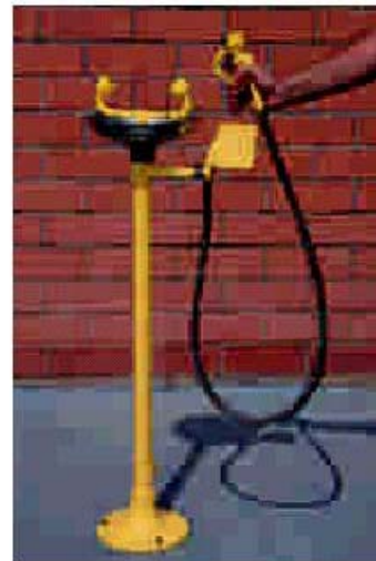
AB02240E AUGENDUSCHE, STANDMODELL, MIT ZUSÄTZLICHER BEWEGLICHER AUGENDUSCHE, AUFFANGSCHALE AUS EDELSTAHL GEFERTIGT